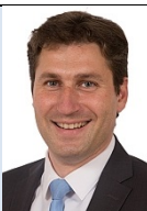
M. Mathieu Darnaud Vice-président (Les Républicains, Ardèche)