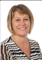
Mme Maryse Carrère Membre (RDSE, Hautes-Pyrénées)