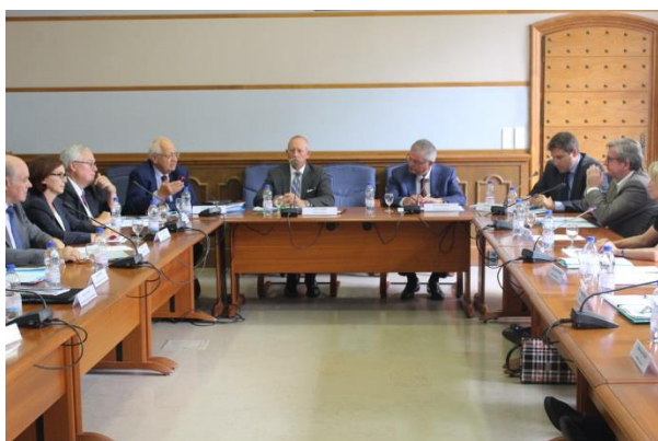
Déplacement de la mission à Chambéry (Savoie) le 15 septembre 2016

Alors que l'essentiel des réformes est entré en vigueur, la mission dresse plusieurs constats :