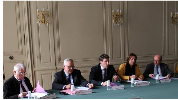
Déplacement de la mission à Châlons-en-Champagne (Marne) le 29 avril 2016

L'État doit procéder au déploiement effectif et généralisé des moyens numériques nécessaires au fonctionnement de cette organisation, tout en veillant au maintien de l'attractivité des sites des anciens chefs-lieux régionaux.