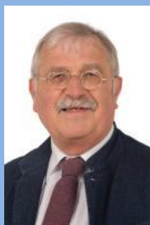
Pierre-Yves COLLOMBAT (Var - RDSE)