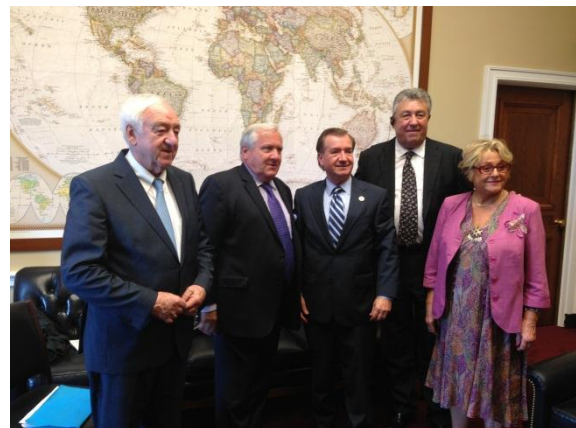
Entretien avec M. Edward Royce, président de la commission des affaires étrangères, Chambre des Représentants

Le rééquilibrage comporte un volet diplomatique : consolidation des alliances traditionnelles (Japon, Corée du sud, Australie...), renforcement des relations avec l'Asie du Sud-Est, investissement dans les instances régionales et négociation du TransPacific Partnership , dialogue stratégique avec la Chine. Il s'accompagne d'une présence militaire renforcée : l' US Navy , et l' US Air Force , disposeront de 60 % de leur forces dans la région à l'horizon 2020 avec un renfort qualitatif et des accords de coopération et de pré-positionnement avec certains États.