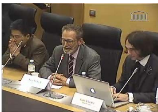
De gauche à droite : MM. Ngô Bảo Châu, Yves Meyer et Cédric Villani

Les conclusions générales de l'audition publique du 14 octobre 2010 ont été présentées lors de la réunion de l'Office du 17 novembre 2010. L'Office avait l'honneur d'accueillir, ce même jour, les lauréats français de la médaille Fields, MM. Ngô Bảo Châu et Cédric Villani, ainsi que le lauréat du prix Gauss, M. Yves Meyer. Ceux-ci ont, notamment, évoqué la place et le rôle des mathématiques en finance.