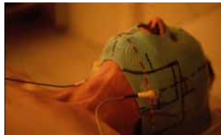
Détecteurs sur le patient de la dose réellement reçue

Les effectifs doivent être rapidement renforcés et de manière très significative, notamment pour les physiciens médicaux. La formation continue des personnels doit être généralisée et régulièrement remise à jour, compte tenu de l'évolution constante des technologies, afin de garantir l'application des nouvelles recommandations : guide de radiothérapie des tumeurs élaboré par la Société française de radiothérapie