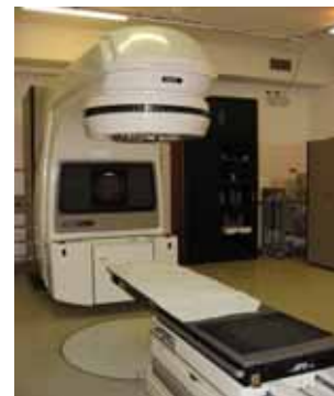
Accélérateur linéaire (RX)

Le Plan Cancer, lancé en 2003 et piloté par l'Institut National du Cancer, (INCA) a permis de rattraper à marche forcée le retard français en matière d'équipements de radiothérapie. Ainsi, les machines au cobalt ont disparu et ont été remplacées par des accélérateurs linéaires.