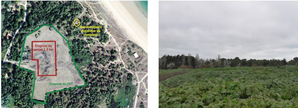
Vue aérienne et photographie de l'ancien CET de l'île d'Yeu.

La commission soutient pleinement cette proposition de loi, qui permettra d'associer les territoires littoraux à la concrétisation des ambitions de la France en matière de transition énergétique. Elle a adopté la proposition de loi, assortie de modifications visant à :