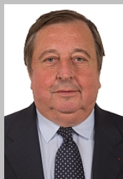
Thierry CARCENAC Rapporteur spécial Sénateur du Tarn (Groupe socialiste et républicain)