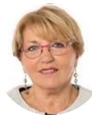
Annie Delmont-Koropoulis Sénatrice (LR) de Seine-Saint-Denis Rapporteuse pour avis