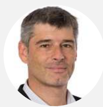
Guillaume Gontard Rapporteur Sénateur de l'Isère (EST)